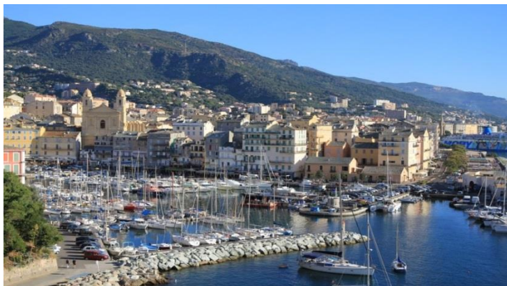
Port de Bastia

Petit-déjeuner à l'hôtel. Matinée consacrée à la visite de Bastia , ville baroque et culturelle construite en 1378 par le gouverneur génois Leonello Lomellini. Découverte de la ville en petit train touristique : sa citadelle, son vieux port.