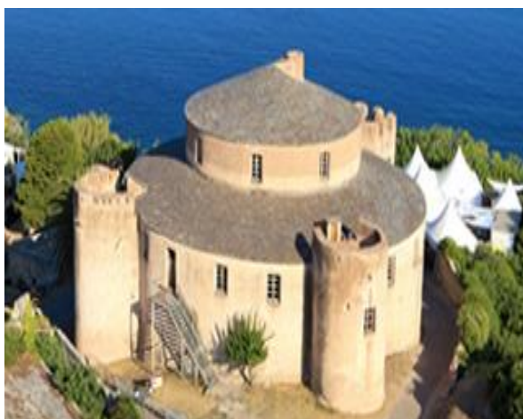
Citadelle de Saint-Florent

Matinée libre - Saint-Florent avec guide