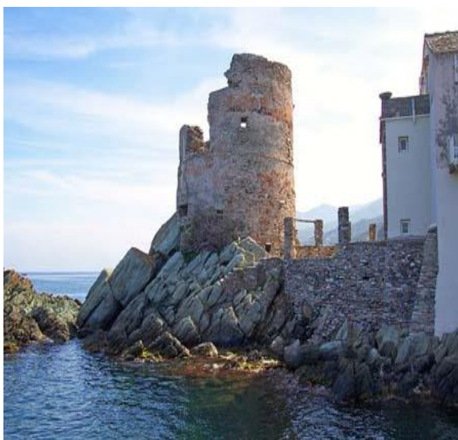
Tour Génoise à Erbalunga