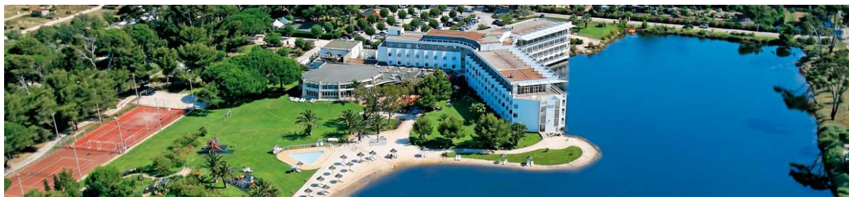
Hôtel Plein Sud