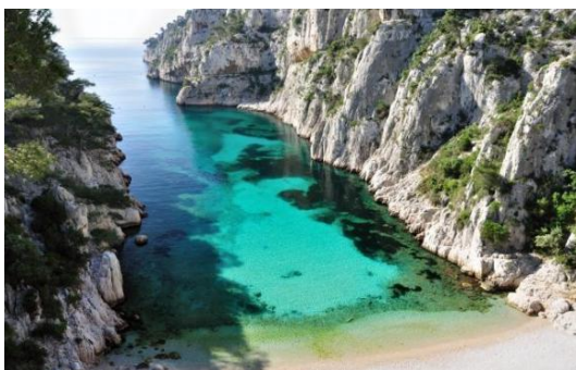
Calanques de Cassis

Arrivée prévue en début de soirée à la Gare Cornavin.