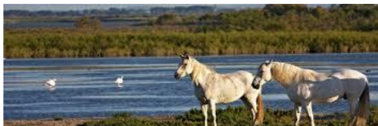
Paysage de Camargue