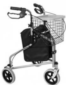
Fr. 150.00 2 paniers